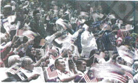
PEMERIKSAAN secara berkala dicadang dilakukan ke atas penjawat awam yang mempunyai tanda-tanda obesiti dan berusia 40 tahun ke atas. - GAMBAR HIASAN

PETALING JAYA - Kongres Kesatuan Pekerja-Pekerja Dalam Perkhidmatan Kerajaan (Cuepacs) mencadangkan agar penjawat awam diwajibkan melakukan pemeriksaan kesihatan secara berkala bagi mereka yang sudah menunjukkan tanda-tanda obesiti dan berusia 40 tahun ke atas.